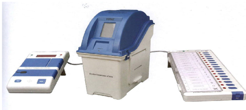
வாக்குச்சாவடியில் EVM-இயந்திரங்கள் வைக்கப்பட வேண்டிய அமைப்பு