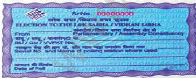
COMMON ADDRESS TAG