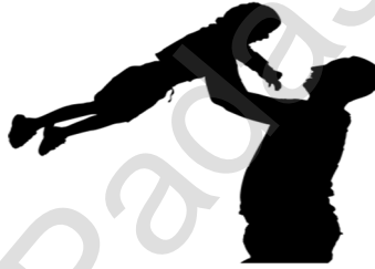
FATHER – SPECIAL HERO