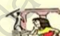
visiter un musée