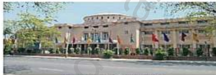
Le musée national de Delhi