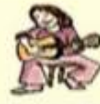
jouer d'un instrument