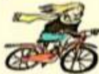
faire du vélo