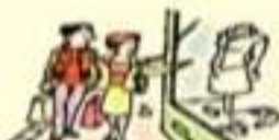
faire du lèche-vitrines