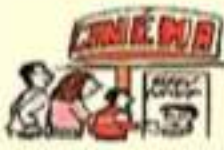
aller au cinéma