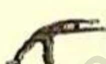
faire de la gymnastique