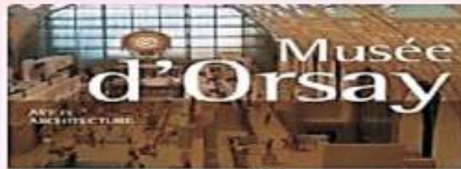
Le musée d'Orsay