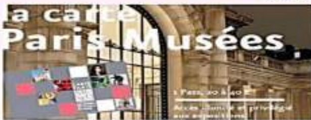
La carte musée