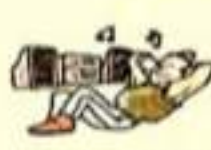
écouter de la musique