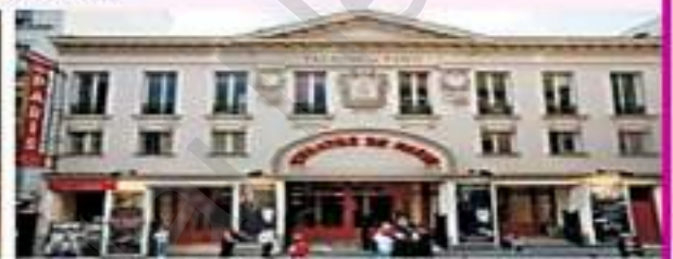
Le théâtre de Paris