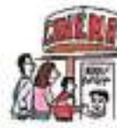
aller au cinéma